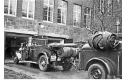
Die Feuerlöschpolizei Lollar in den 30er-Jahren.

Mit der Zeit gingen die einzelnen Orte eigene Wege, schafften sich eigene Ausrüstung an. In Lollar mündete diese Entwicklung schließlich 1876 in einen entscheidenden Schritt: der Gründung einer eigenen Freiwilligen Feuerwehr. Initiiert von engagierten Bürgern aus Turn- und Gesangsverein, zunächst skeptisch beäugt – nicht zuletzt wegen der Kosten. Erst die Unterstützung aus der Industrie brachte Bewegung in die Sache. Noch im selben Jahr fanden sich 70 Männer zusammen – die Freiwillige Feuerwehr Lollar war gegründet. Die Anfangsjahre waren geprägt vom Aufbau: Uniformen, Schläuche, erste technische Ausrüstung. Schritt für Schritt entwickelte sich aus der Gemeinschaft eine verlässliche Einsatztruppe. Um die Jahrhundertwende war die Wehr fest im Ort verankert, Jubiläen wurden gefeiert, Gründungsmitglieder geehrt. Ein erster großer technischer Sprung folgte Ende der 1920er Jahre mit der Anschaffung einer Motorspritze. Bis dahin war vieles Handarbeit – nun hielt Motorisierung Einzug. Alarmiert wurde weiterhin per Sirene oder sogar durch Hornisten. Es waren andere Zeiten, aber der Anspruch blieb derselbe: Hilfe leisten, wenn sie gebraucht wird. Die Jahre des Nationalsozialismus brachten Veränderungen auch für