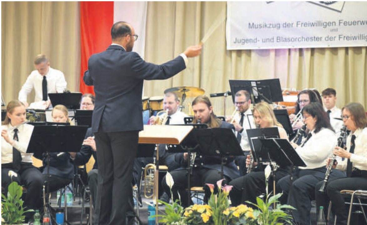
Am 16. Mai findet in der Stadthalle Staufenberg das Frühjahrskonzert des Musikzuges statt.