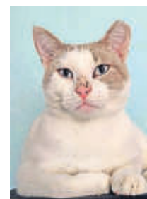
Wer hat einen Platz für Pipo?

» Kontakt und weitere Informationen zu Pipo und anderen Tieren, gibt es unter www.tie-roase-heuchelheim.de , per Mail: iluja@gmx.de , Telefon: 0157-71471566