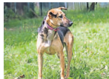
Stella, geboren im April 2022.

Im Hundekontakt zeigt sich Stella sehr unterschiedlich. Besonders bei Hunden, die unsicherer sind als sie, gibt sie gerne den Ton an und regelt, wer sich wie bewegen darf. An Hunden die sie mag orientiert sie sich aber sehr und kann sehr lustig und verspielt sein. Die Arbeit mit Stella kommt dann an Grenzen, wenn Menschen mehr von ihr wollen als Tricks und lustige Dinge. Anleinen, ein Geschirr oder Maulkorb anziehen. Sie ist in Situationen in denen sie vermeintlich unter Druck gerät schnell verunsichert und dann nicht mehr in der Lage zu denken oder zu arbeiten. Daher ist für Stella ein Spazier-