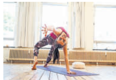
Eine Frau macht Yoga.

Daneben gibt es noch viele weitere Yoga-Stile: Kundalini Yoga beispielsweise legt einen starken Fokus auf die Spiritua-