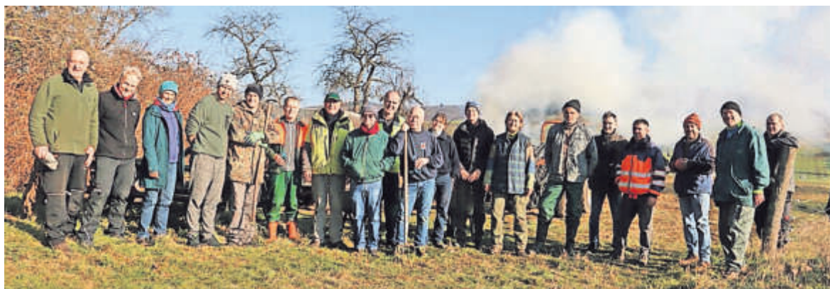
Die Teilnehmer nach der Aktion im Sonnenschein auf dem Köppel.

NABU/VNULL Langd entfernt Gehölzaustriebe