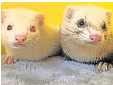
Cagney und Lacey.

werden, sollte aber nie die Hauptnahrungsquelle sein, da Frettchen einen höheren Eiweißbedarf haben. Wichtig ist, Zucker und Getreide zu vermeiden, da Frettchen diese schlecht vertragen.