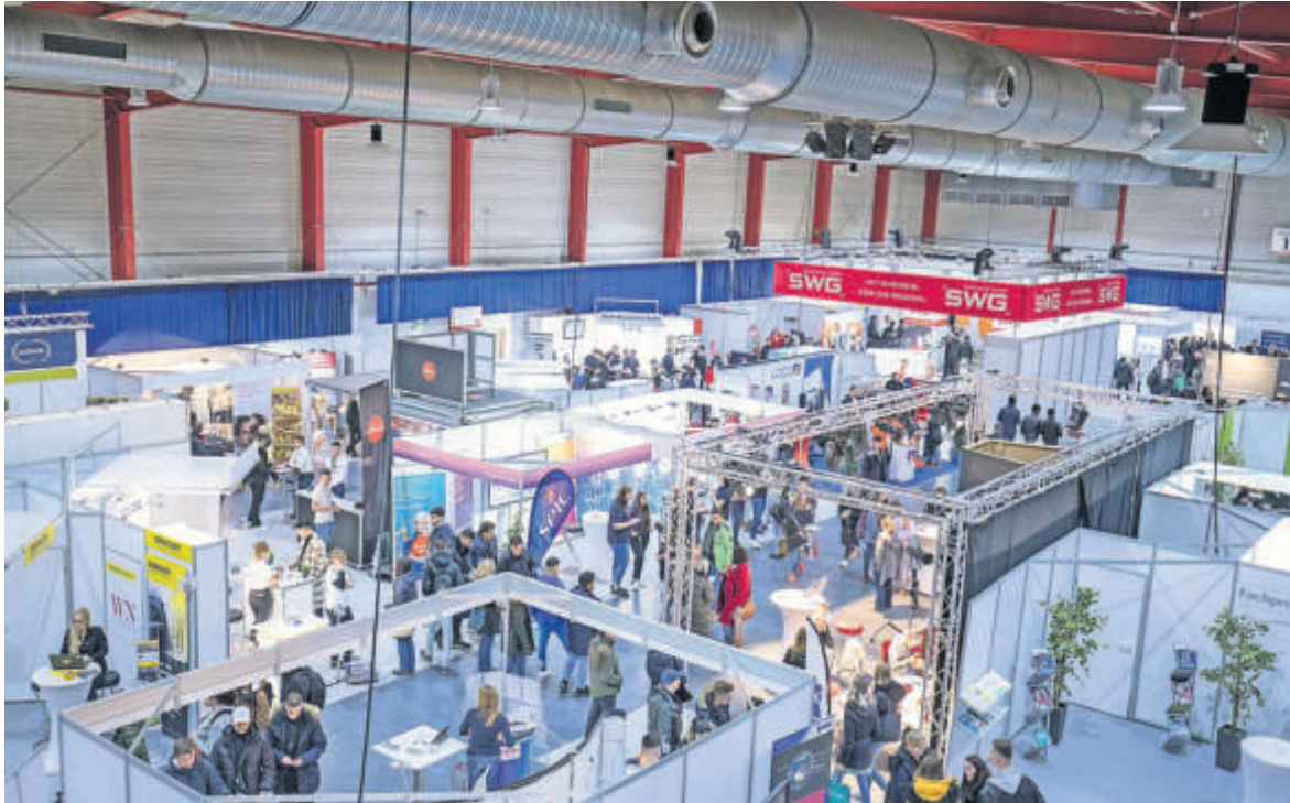
Hessens größte Messe für Beruf und Karriere, die Chance, bietet morgen und am Montag in Gießen Perspektiven mit rund 230 Ausstellern.