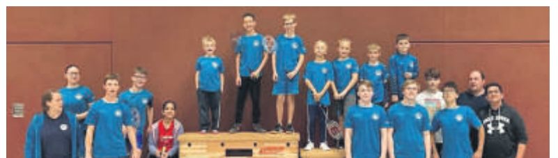
Die Teilnehmer des Bv Hungen an der letzten Rangliste in Hungen.

» Zuschauer sind herzlich willkommen. Der Eintritt ist frei. Für die Verpflegung ist bestens gesorgt.