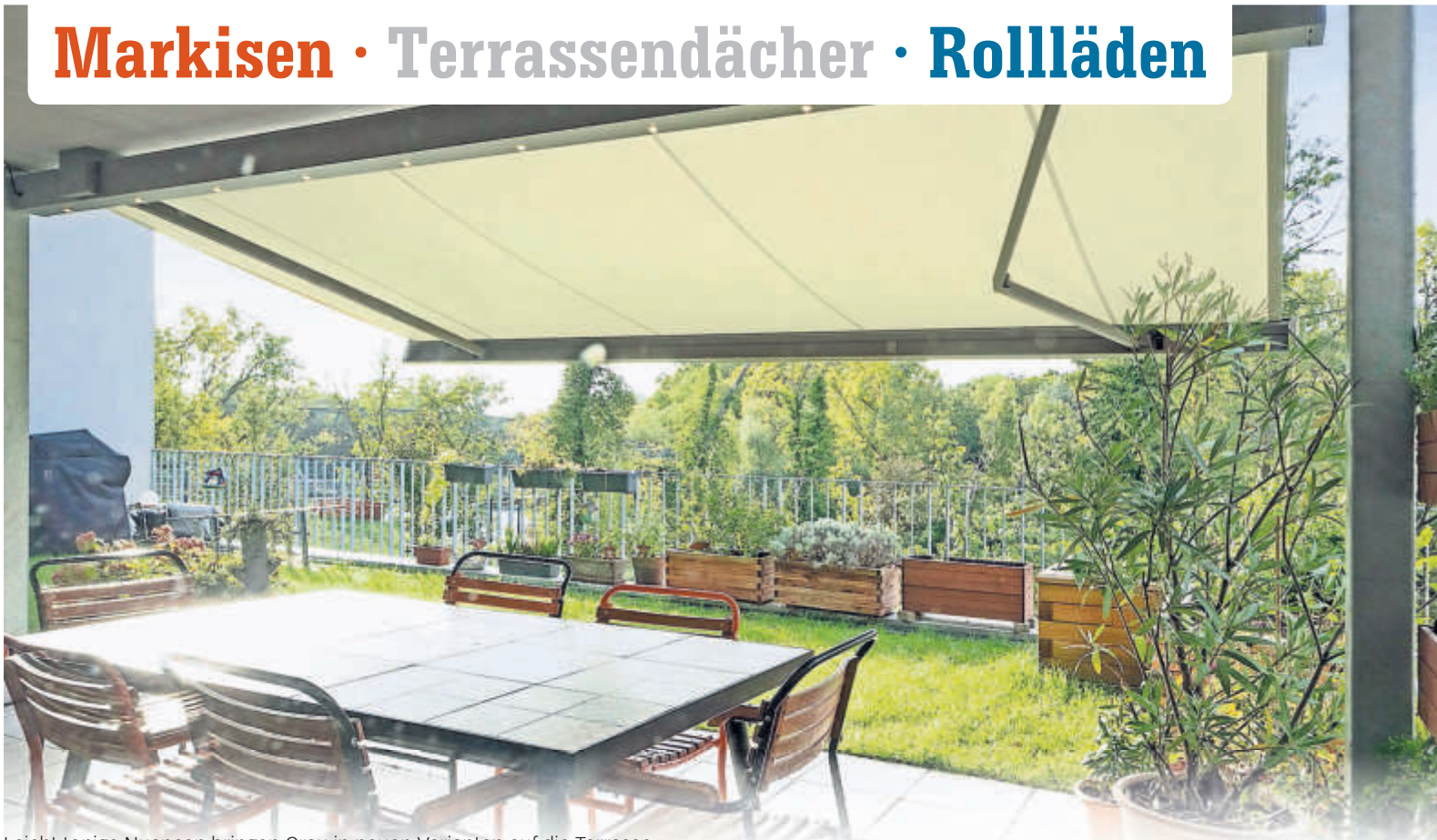
Leicht tonige Nuancen bringen Grau in neuen Varianten auf die Terrasse.