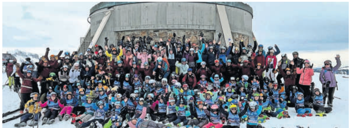
Auch in diesem Jahr war es wieder eine tolle und erfolgreiche Skifreizeit.

Dort wurden die 72 Kinder inklusive 9 Anfänger durch die 14 vereinseigenen Ski-Übungsleiter in Gruppen eingeteilt, um anschließend direkt mit dem insgesamt 5-tägigen Skikurs zu beginnen. Der Montag war leider durch das Wetter geprägt, so dass der Skikurs an