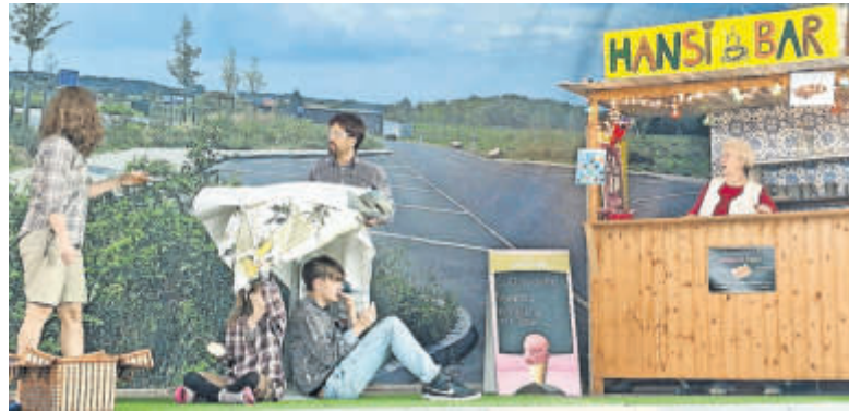
Die komödiantische Theaterstück „Currywurst mit Pommes“.

Das satirische Stück spielt mit allen be-