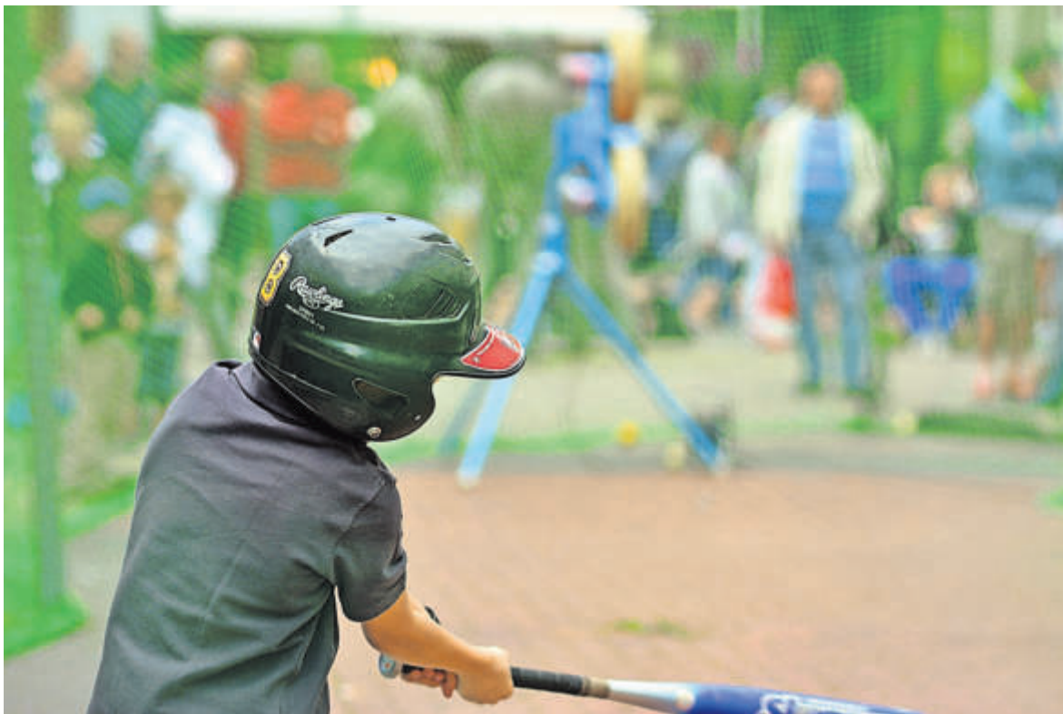
Am Sonntag, den 28. April, verwandelt sich die Gießener Innenstadt in ein großes Sportgelände.