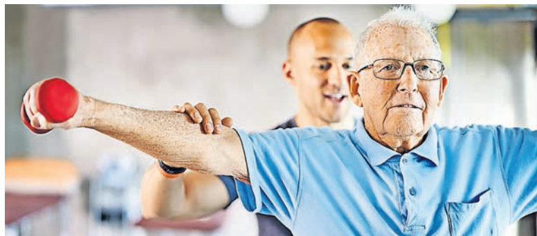
Schmerzen reduzieren durch gezielte Trainingstherapie.

Rückenschmerzen sind in unserer modernen Gesellschaft zu einer der häufigsten Beschwerden geworden und beeinträchtigen das tägliche Leben zahlreicher Menschen. Um diesem weit verbreiteten Problem entgegenzuwirken,