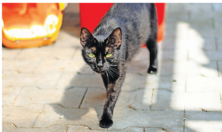
Lilly, EKH, sucht ein neues Zuhause.

» Kontakt und weitere Informationen über: Tierschutzverein Gießen und Umgebung e.V. Mitgliedsverein DEUTSCHER TIER-SCHUTZBUND e.V. Vixröder Straße 16 35396 Gießen Telefon: 0641/5 22 51 E-Mail: info@tsv-giessen.de http://www.tsv-giessen.de