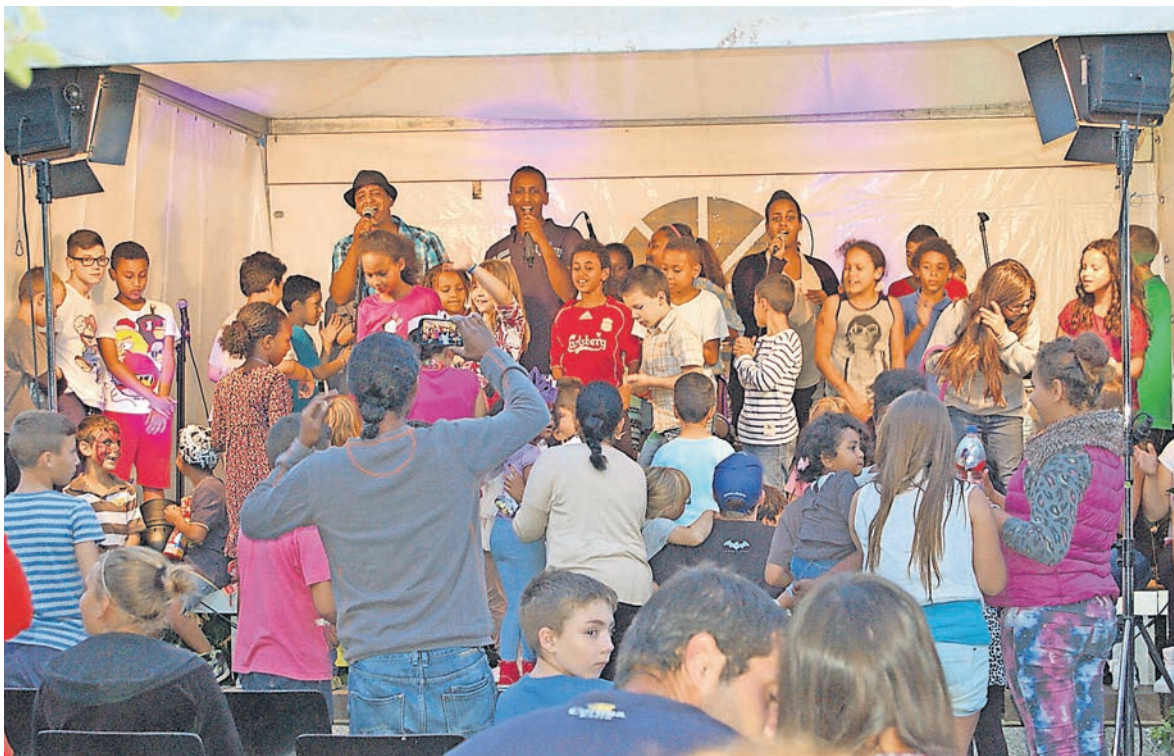
Freuen Sie sich auf schöne Stunden mit köstlichen Leckereien.