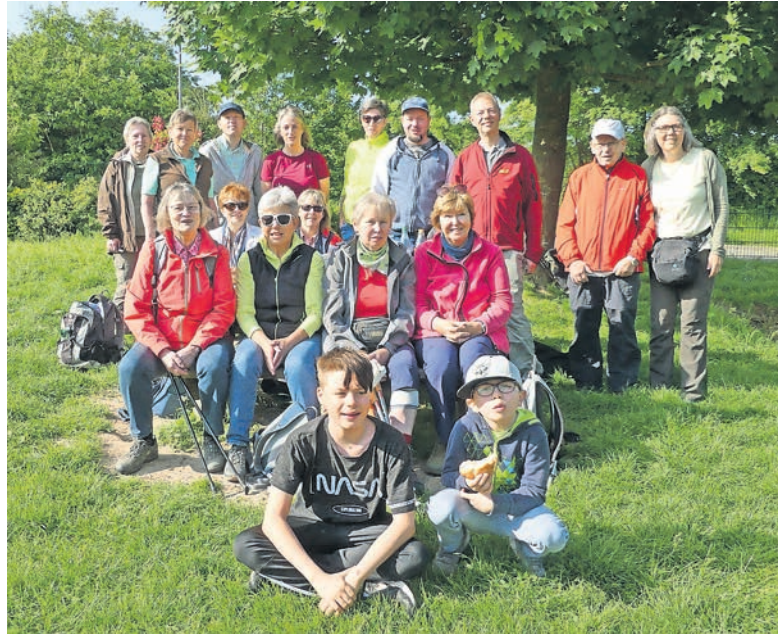
Groß und Klein gemeinsam von Braunfels nach Weilburg.

Bedingt durch die Wartezeit auf den Bus hielt Pfarrer Heide zu Beginn der Tour eine Andacht und las noch eine Geschichte: Jesus tauchte in Frankfurt auf, trug einer alten Frau die Einkaufstasche, half einer Türkin, die kein Deutsch konnte, schob einen Gelähmten durch den Palmengarten, spielte mit einem behinderten Mädchen Ball, besuchte eine krebserkrankte Frau im Krankenhaus, die noch nie Besuch hatte, sprang mit einem ängstlichen Jungen vom Dreimeterbrett und vieles mehr.