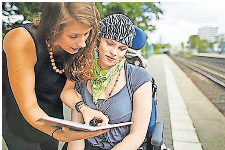
Mit einem FSJ erste Berufserfahrungen sammeln.

„In einer ungezwungenen und offenen Atmosphäre möchten wir Interessentinnen und Interessenten gerne