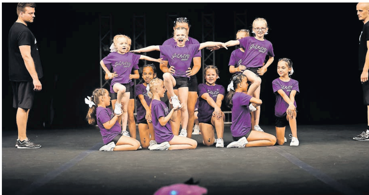
GalaxyCheer Milkyways_Gießener TanzClub74.

Die Milkyways, unser talentiertes Team, begeisterte das Publikum und die Jury mit einer herausragenden Leistung in der Kategorie Open Peewee Level 0. Mit ihrer perfekt ausgeführten Routine und ihrem harmonischen Zusammenspiel präsentierten sie eine beeindruckende Darbietung.