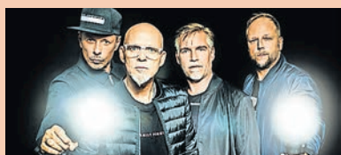
Die Fantastischen Vier.