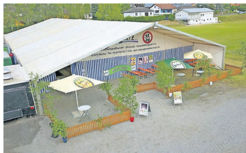
4 tolle Kirmestage für die ganze Familie..