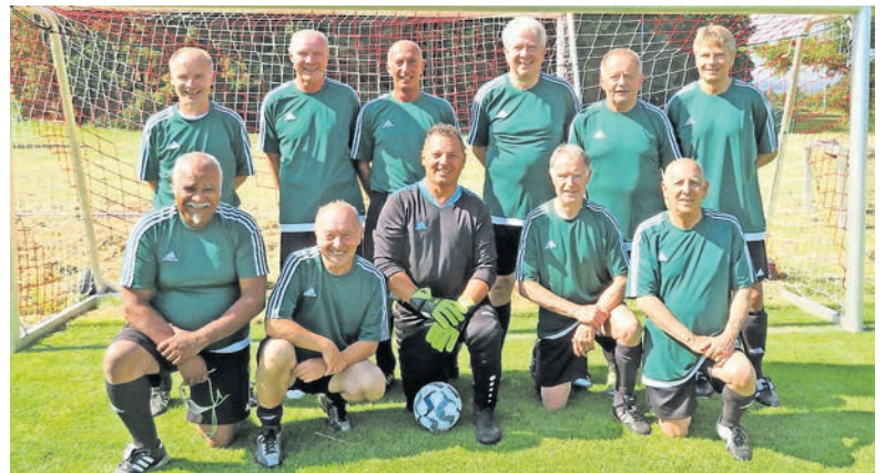
Ü 60 Hessen Cup 2023.