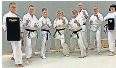
Der neue Trainerstab

Das Karate-Dojo Mikado richtet sich insbesondere an Studierende und Aka-